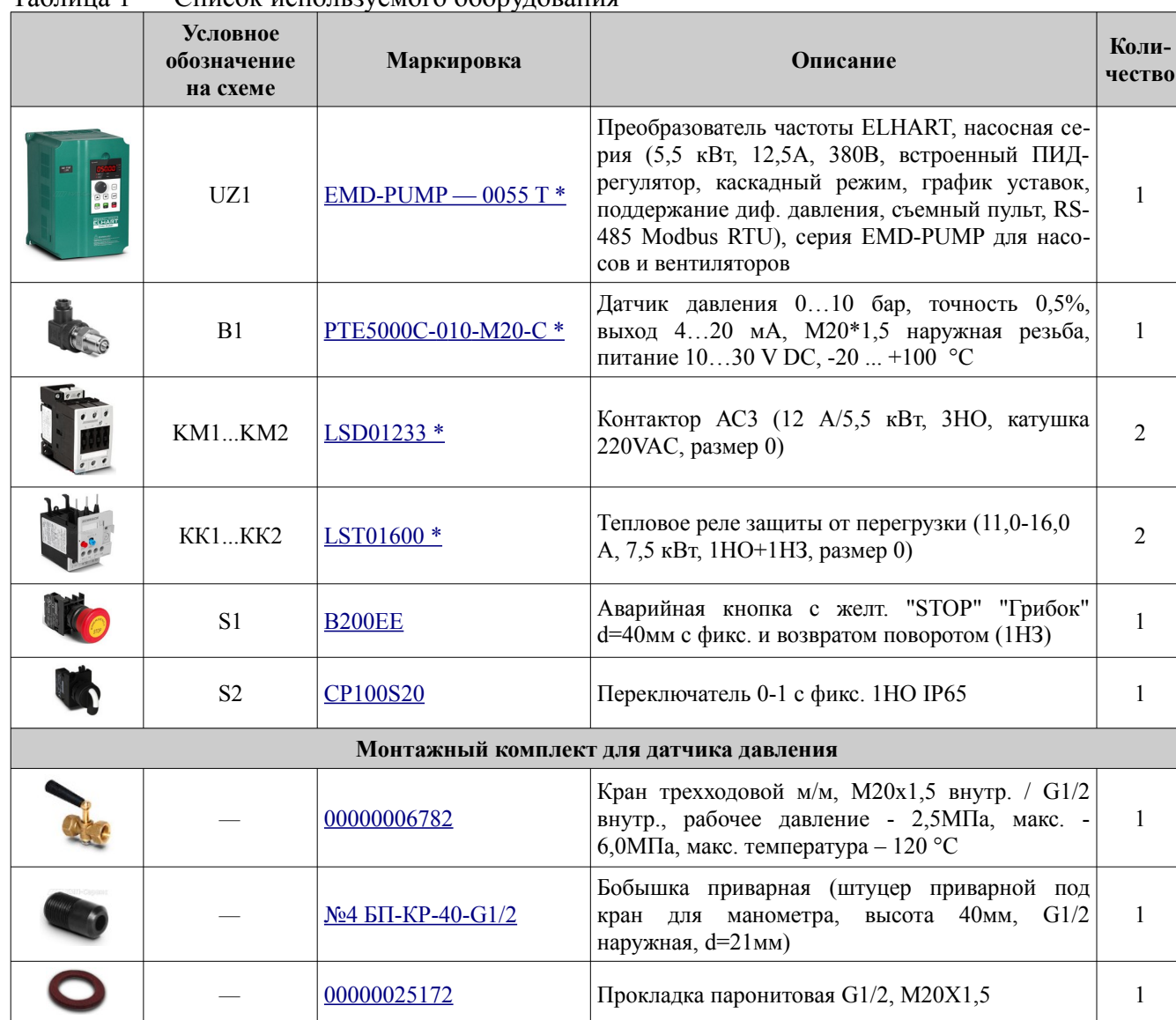
Таблица 1 — Список используемого оборудования

* — модификация определяется при заказе.